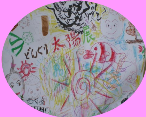
昨年の展示会で皆で描いた絵

特別イベント 5月3日(祝) 「みんなで歌おう&お絵かき」 ① 1時～1時40分②3時20分～4時 ウクレレ、パンフルート、ハーモニカ演奏