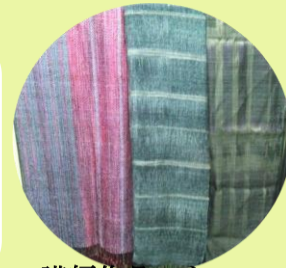
講師作品ストール

卓上の織機で60センチ幅の織物が出来ます。裂いた布や糸を使っても織れます。コートやジャケットなど、自分だけのオリジナルを織ってみませんか！