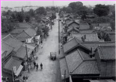
昔の本町通り・昭和33年