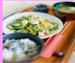
左から沖縄そば 650円 美ら風セット 750円 角煮カレー700円 ゴーヤチャンプルS 750円