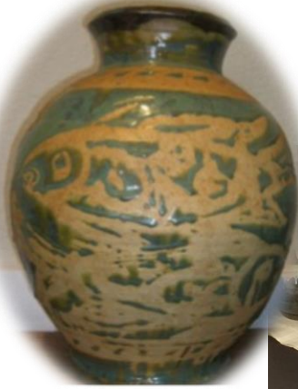
蠟抜緑釉指搔文大壺