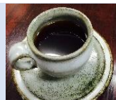
ホットコーヒー 440円 ミックスジュース 550円