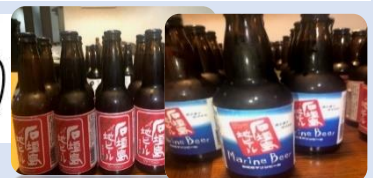
石垣島地ビール 650円 (生酵母入り)