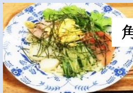
角煮入り沖縄そば 820円