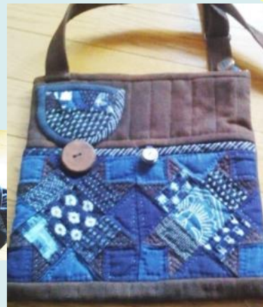
和の小物・パッチワーク