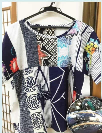
さいたま市 竹内 恵子