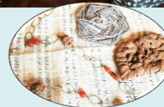
籐のバック アクセサリ