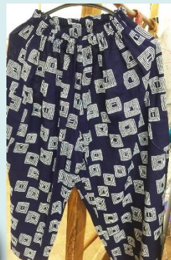
和の創作服と小物