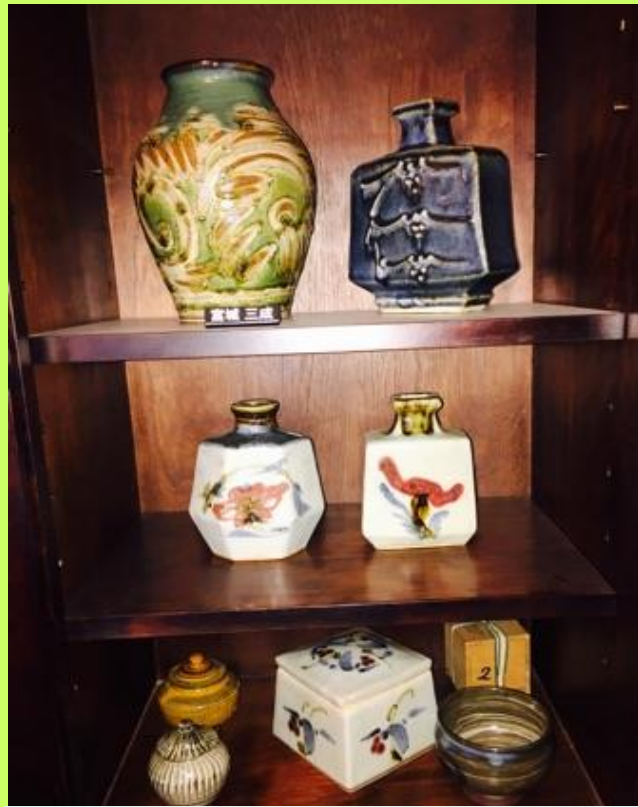
宮城三成 1968年生（須美子 三男 次郎の孫）