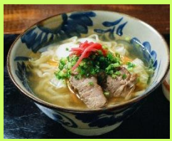
沖縄そば 上 南風御膳 下