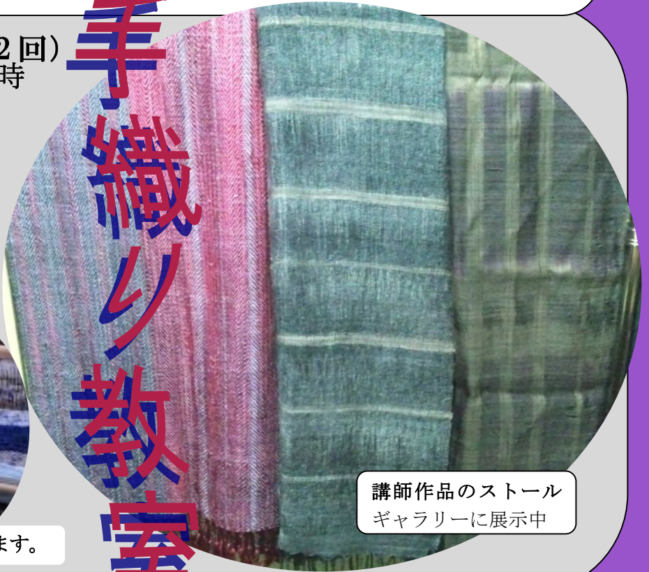
講師作品のストール ギャラリーに展示中